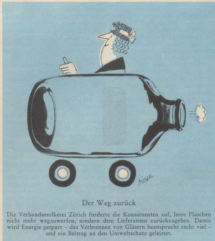
Der Weg zurück

Ich habe nämlich im «Bund» gelesen, dass die drei Dachverbände der Schweizer Frauen das