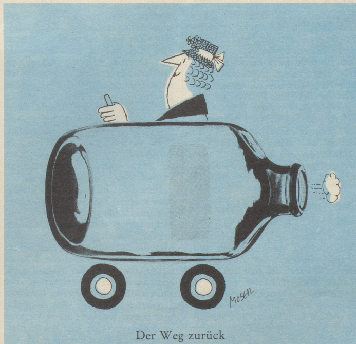
Der Weg zurück

Ich habe nämlich im «Bund» gelesen, dass die drei Dachverbände der Schweizer Frauen das