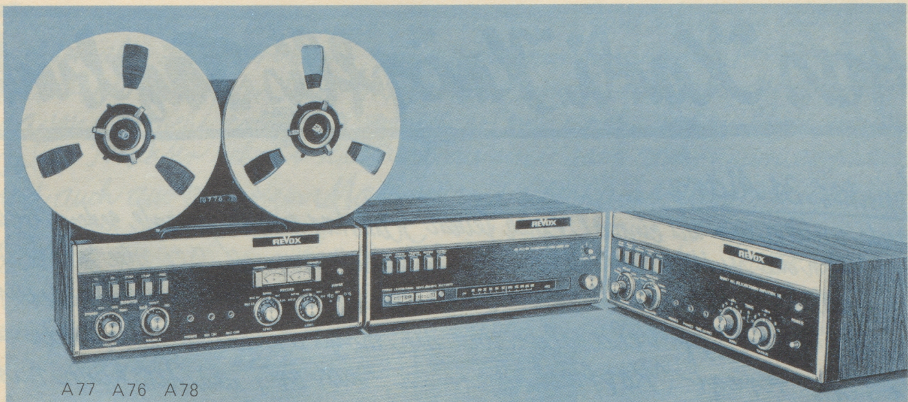
A77 A76 A78