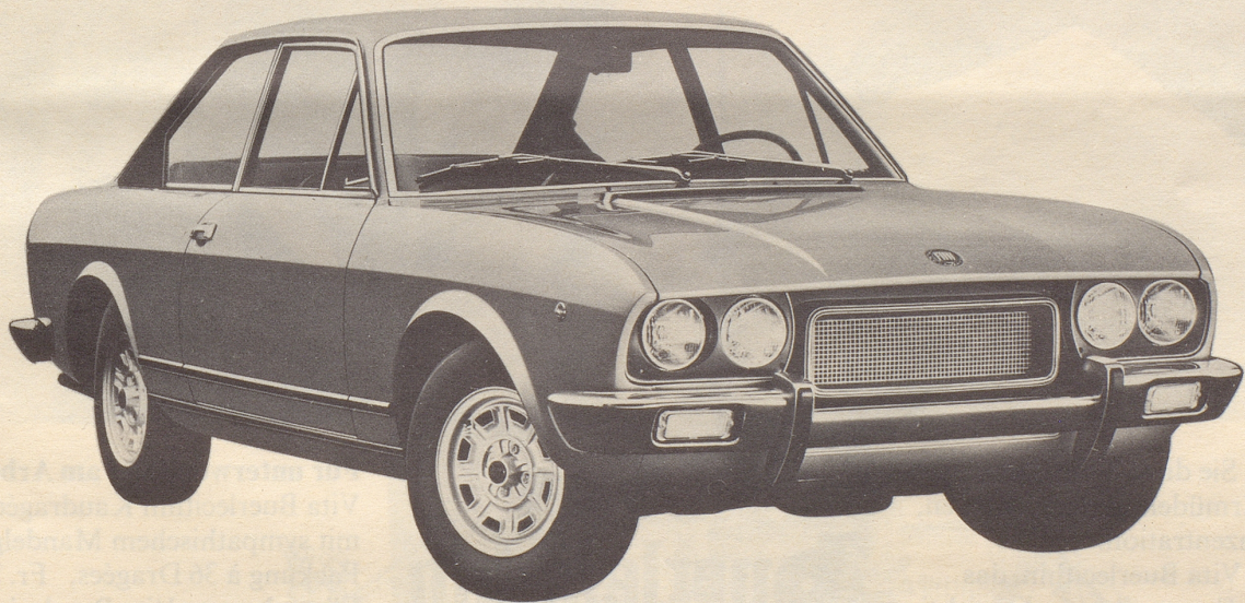
Der neue Fiat 124 Sport Coupé 1800

Früher oder später möchte fast jeder Mann einen Sportwagen besitzen. Aber für allzu viele hört dieser Traum dann auf, wenn das Familienleben mit Frau und Kindern anfängt.