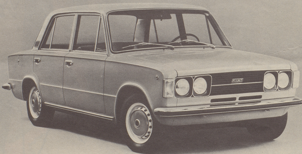
Ein neuer Fiat 124: der 124 Special T