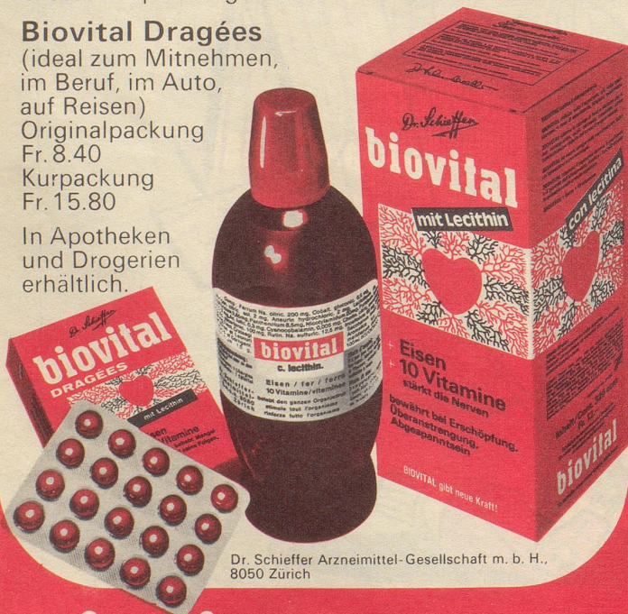
Dr. Schieffer Arzneimittel-Gesellschaft m. b. H., 8050 Zürich

biovital gibt neue Kraft und frische Energie!