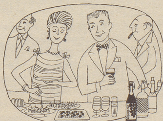
Am Party-Buffer darf er nicht fehlen, der beliebte gehaltvolle Traubensaft