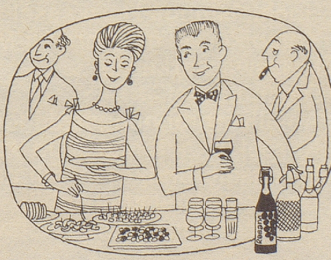
Am Party-Buffer darf er nicht fehlen, der beliebte gehaltvolle Traubensaft