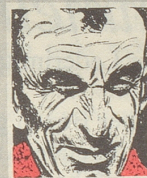
Us em Innerrhoder Witz- tröckli

* PS. Karl Spitteler nahm 1900 die Arbeit an seinem Versepos «Der olympische Frühling» auf. Spitteler erhielt den Nobelpreis für Literatur; 1901 nahm die Nobelstiftung ihre Tätigkeit auf.