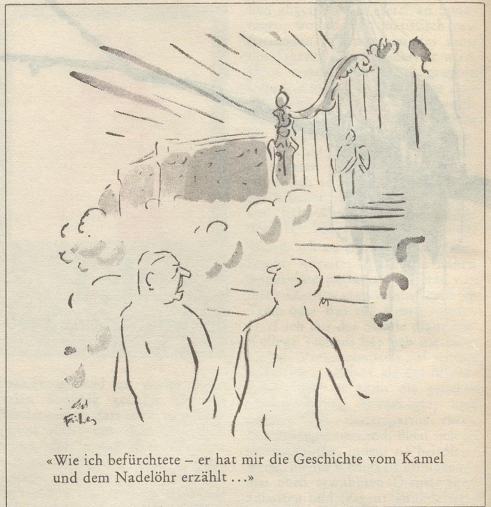
«Wie ich befürchtete – er hat mir die Geschichte vom Kamel und dem Nadelöhr erzählt ...»