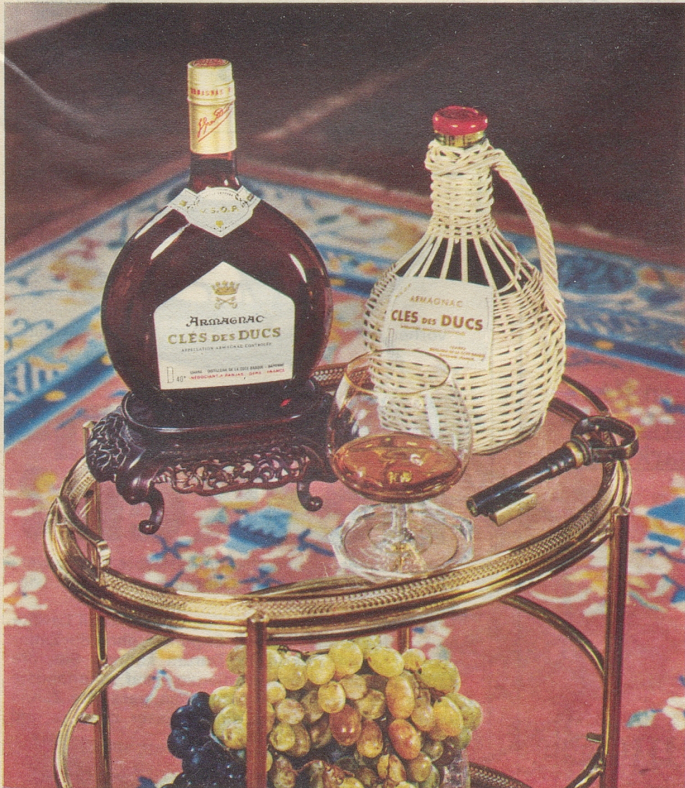
Armagnac CLES des DUCS, die Marke des Kenners

Generalvertretung: Emil Benz Import AG, 6340 Baar, Tel. 042 / 31 66 20