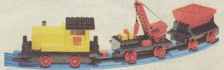
724 12-V-Zug mit Diesellokomotive.