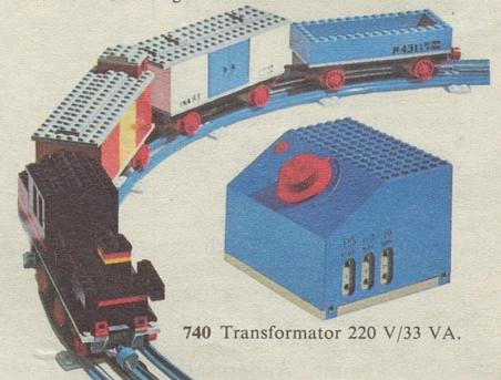
740 Transformator 220 V/33 VA.