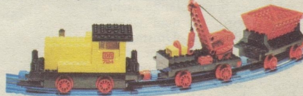
724 12-V-Zug mit Diesellokomotive.