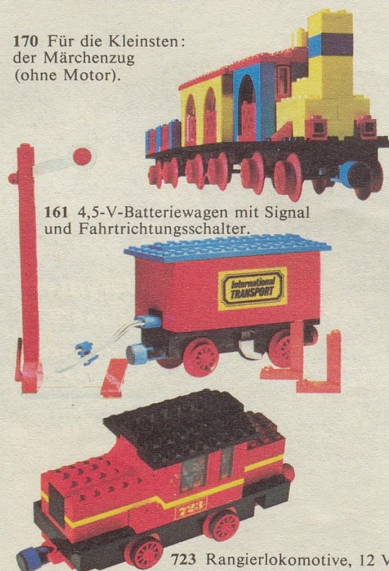
161 4,5-V-Batteriewagen mit Signal und Fahrtrichtungsschalter.