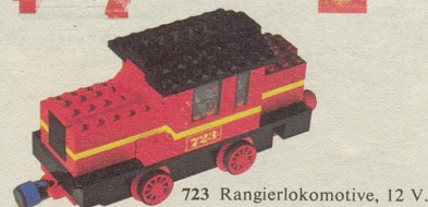
723 Rangierlokomotive, 12 V.