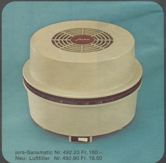
jura-Sanamatic Nr. 492.23 Fr. 180.– Neu: Luftfilter Nr. 492.90 Fr. 19.50