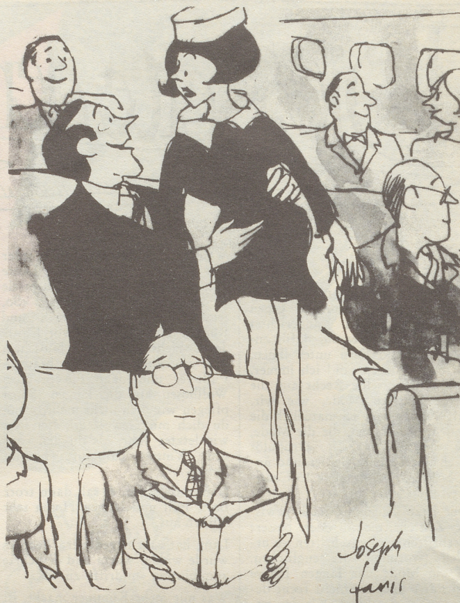
«... aber bitte, Fräulein... eben noch flüsterten Sie übers Mikrofon, wie glücklich Sie seien, dass ich mit der Swissair fliege»

Ein ganz ganz anderer Fall ist es, wenn umgekehrt ein Mami auch einmal in eine Notsituation gerät. Es würde mir nie (mehr) einfallen, die nette Lehrerin anzufragen, ob mein Kind bei der anderen Klassengruppe bleiben und seine Aufgaben dort im Klassenzimmer machen dürfte, etwa während einer