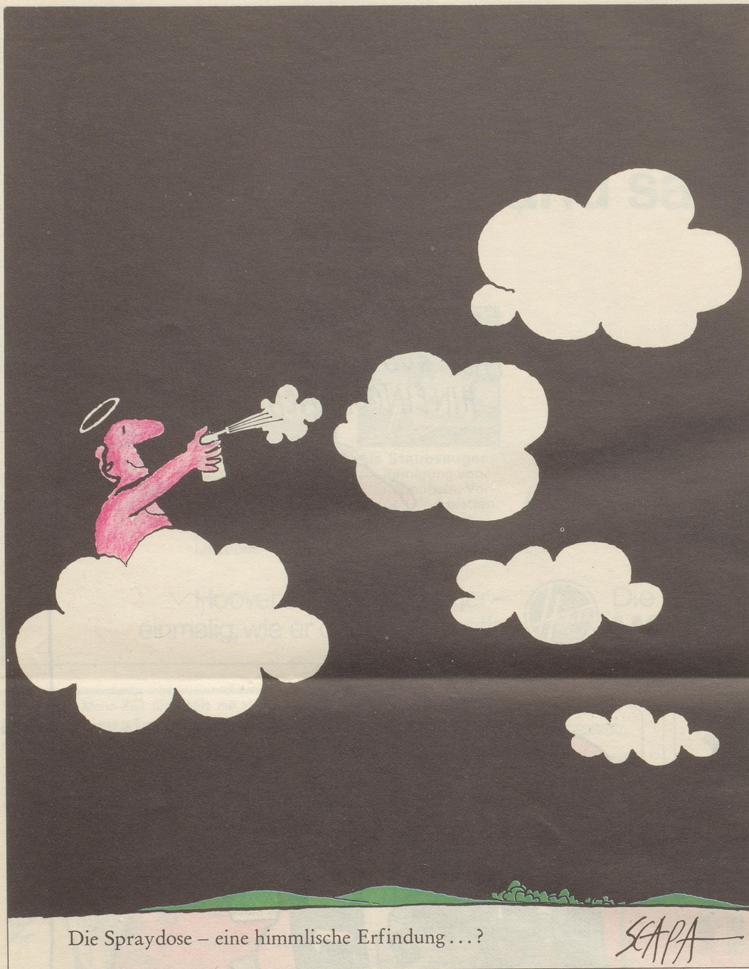
Die Spraydose – eine himmlische Erfindung...?