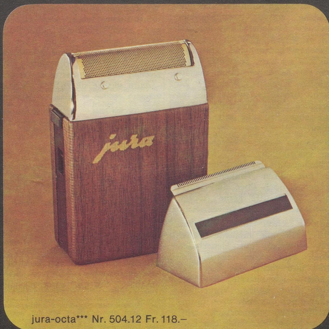
jura-octa*** Nr. 504.12 Fr. 118.–

sunde Luft zu haben. Mit dem jura-Sanamatic. Der jura-Sanamatic ist ein Luftreiniger und ein Luftbefeuchter. Das patentierte jura-Verdunster-System sorgt dafür, dass die Zimmerluft die richtige, gleichbleibende Feuchtigkeit erhält. Neu: zum jura-Sanamatic gibt es den Luftfilter, der die Luft reinigt, bevor sie befeuchtet wird. Mit dem jura-Sanamatic haben Sie gesunde, frische Schweizer Luft in allen Räumen – und zu jeder Zeit. Und das zu nur etwa 2 Rappen im Tag. Tun Sie etwas für die Gesundheit Ihrer Familie. Kaufen Sie den jura-Sanamatic.