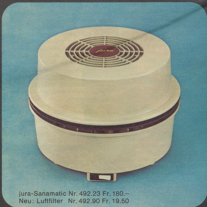
jura-Sanamatic Nr. 492.23 Fr. 180.– Neu: Luftfilter Nr. 492.90 Fr. 19.50