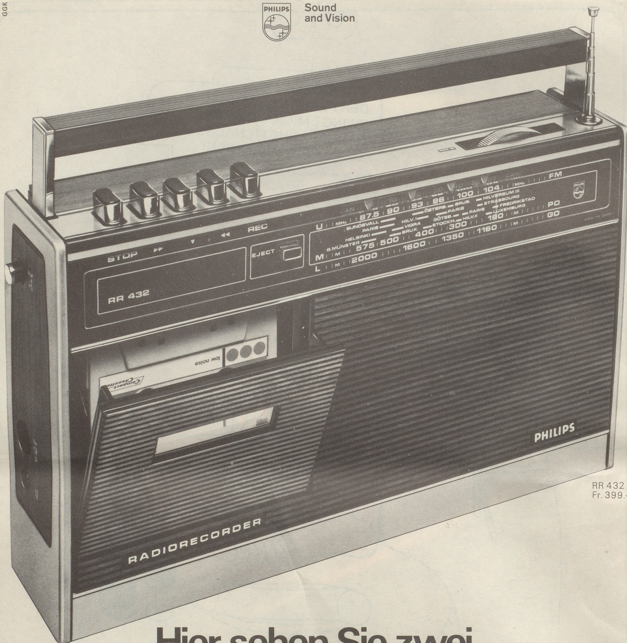
RR 432 Fr. 399.—