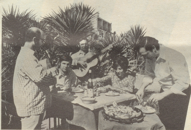
Wo man singt, da lass Dich ruhig nieder.

Jedes Ferien-Paradies hat also seinen Preis. Nur: Wir können zu unseren Preisen stehen. Wenn wir Ihnen ein Hotel mit Meersicht versprechen, liegt das Meer nicht 16 Kilometer entfernt im Dunst vor Ihnen. Und auf