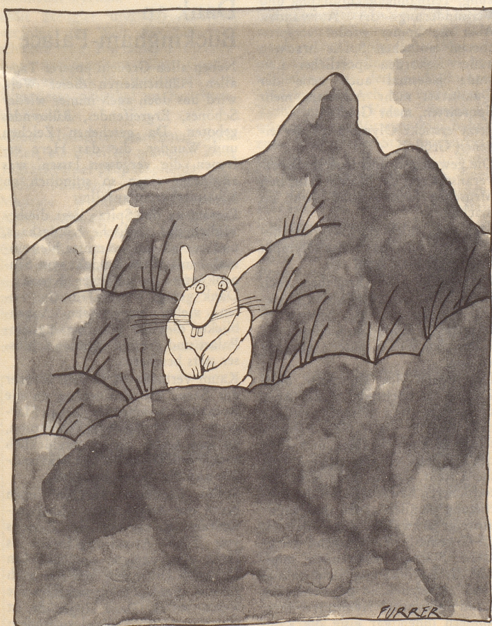
Schneehase, sich furchtbar genierend, da im Winterpelz. (Jan. 1973, 2193 m ü. M.)