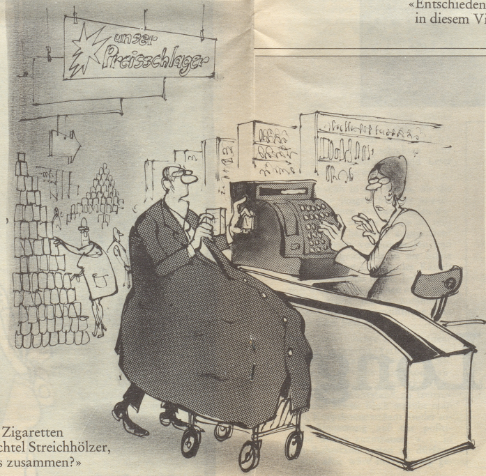
«Ein Päckchen Zigaretten und eine Schachtel Streichhölzer, was macht das zusammen?»