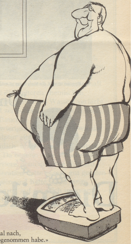
«... Schatzi, schaust du bitte einmal nach, wieviel ich wieder abgenommen habe.»