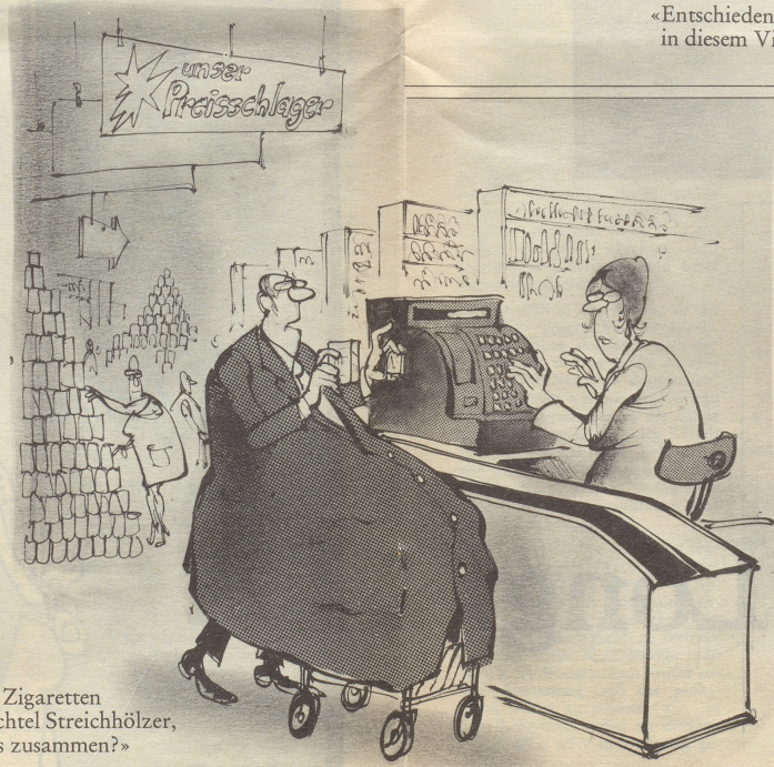
«Ein Päckchen Zigaretten und eine Schachtel Streichhölzer, was macht das zusammen?»