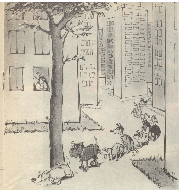
«Entschieden zu wenig Bäume in diesem Viertel!»