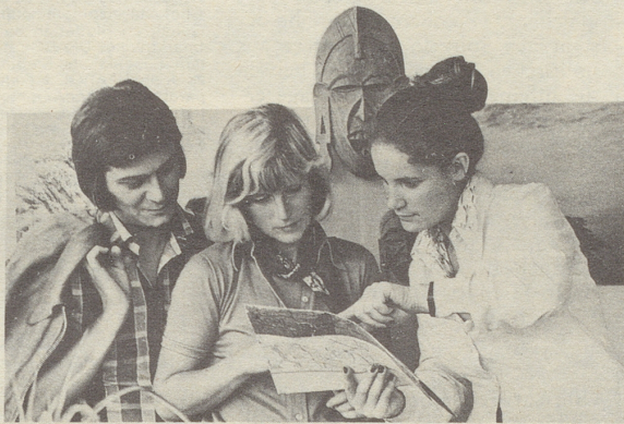
«...nach der 17. Kurve links begegnen Sie den ersten Löwen.»

S' Agnes hatte schon als Kind nichts als Reisen im Kopf. Als Fräulein Lienhard ist sie nun seit Jahren bei uns. Als Hostess. Ein Glücksfall? Eben doch wieder nicht. Denn wer bei uns als Hostess tätig ist, muss schon etwas mitbringen. Damit alle, die mit uns reisen, auch etwas von der Reise haben. Sei es nun in Ostafrika, Rio, Ceylon, Bangkok, Mexiko, Tahiti oder wohin