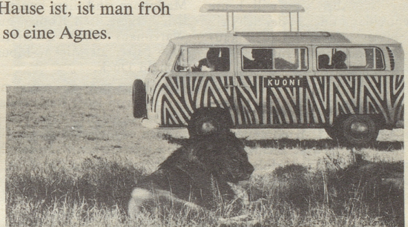
Hier sind sie ja schon. Muuhh, Muuhh!

freundlich sind, sondern sich in einer fremden Stadt, in einem fremden Land, in allen Sitten und Unsitten auskennen.