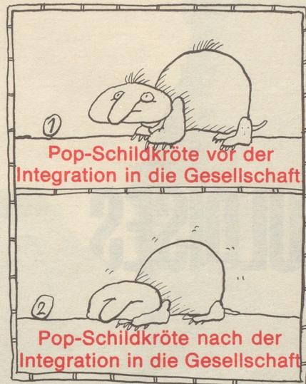
Pop-Schildkröte vor der Integration in die Gesellschaft