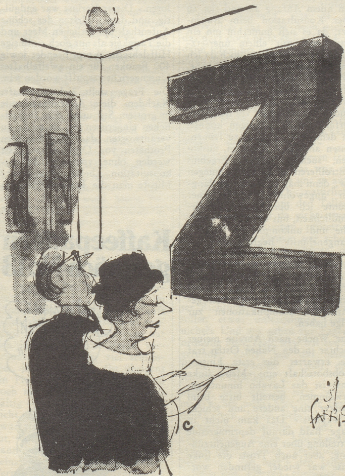
«Er nennt es ‹Z›!»

Etwas will ich Dir noch mit auf den Weg in die Badi mitgeben: Verabrede Dich noch im Bikini (sollte Deine Figur nicht ganz tipptöppel sein, ziehe lieber ein Badekleid an). (Darauf wärs Du sicher nieeee allein gekommen!)