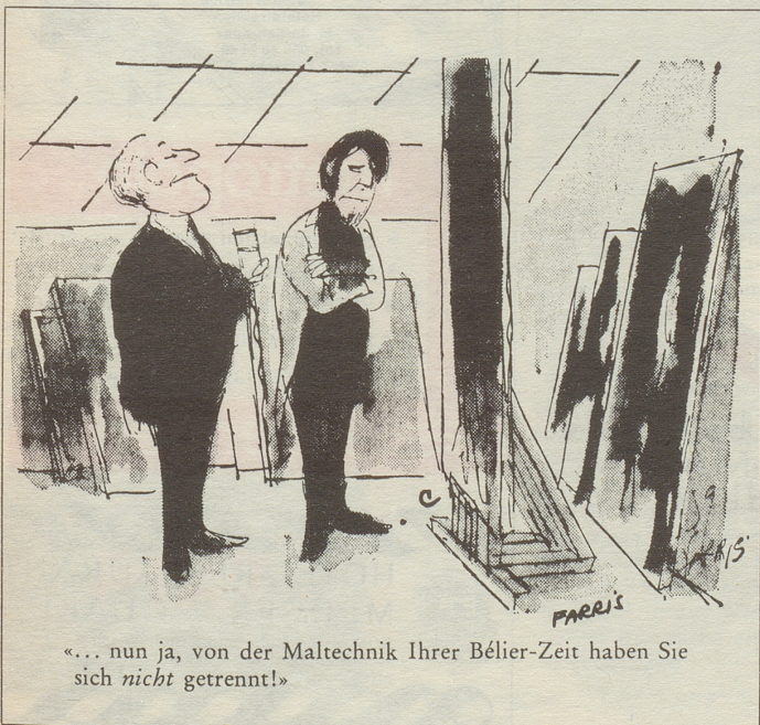
«... nun ja, von der Maltechnik Ihrer Bélier-Zeit haben Sie sich nicht getrennt!»

Wenn es heiss ist, und der Gewitterregen die Luft nur feuchter, aber nicht kühler macht, dann sind die Hundstage da. Dabei sind die Hunde gar keine Liebhaber tropischer Hitze. Und wenn unser Fido anstatt Gassi zu gehen, seine Freizeit lieber auf unserem schönen Orientteppich von Vidal an der Bahnhofstrasse 31 in Zürich verbringt, dann wissen wir, dass der Klügere nachgeben sollte. Und bleiben auch an der Kühle!