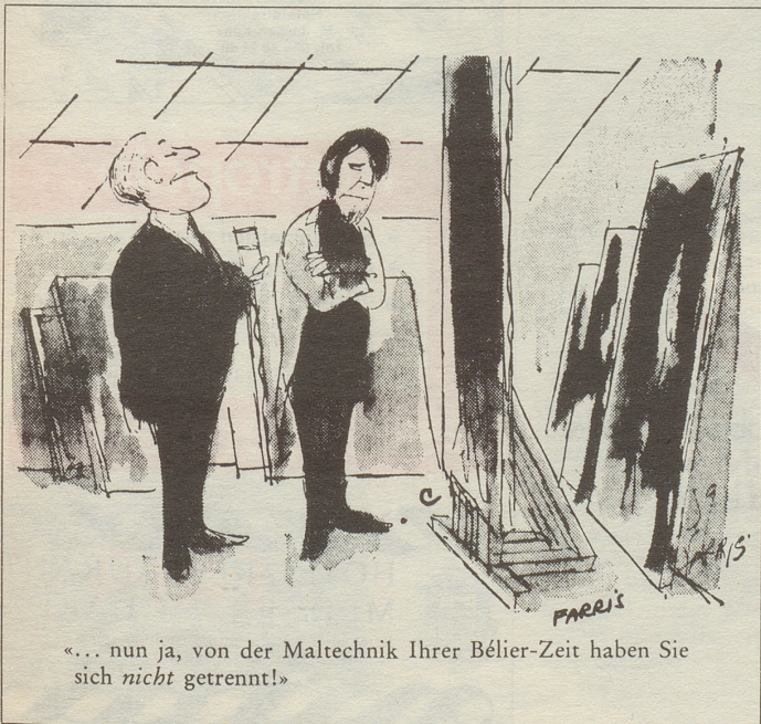
«... nun ja, von der Maltechnik Ihrer Bélier-Zeit haben Sie sich nicht getrennt!»

Wenn es heiss ist, und der Gewitterregen die Luft nur feuchter, aber nicht kühler macht, dann sind die Hundstage da. Dabei sind die Hunde gar keine Liebhaber tropischer Hitze. Und wenn unser Fido anstatt Gassi zu gehen, seine Freizeit lieber auf unserem schönen Orientteppich von Vidal an der Bahnhofstrasse 31 in Zürich verbringt, dann wissen wir, dass der Klügere nachgeben sollte. Und bleiben auch an der Kühle!