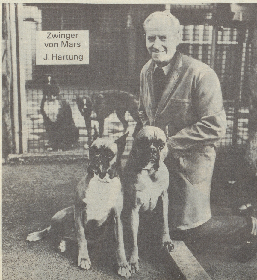
Zwinger von Mars J. Hartung