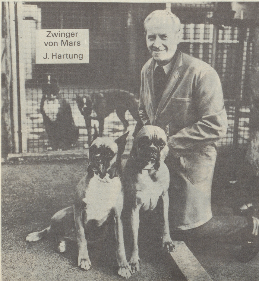
Zwinger von Mars J. Hartung