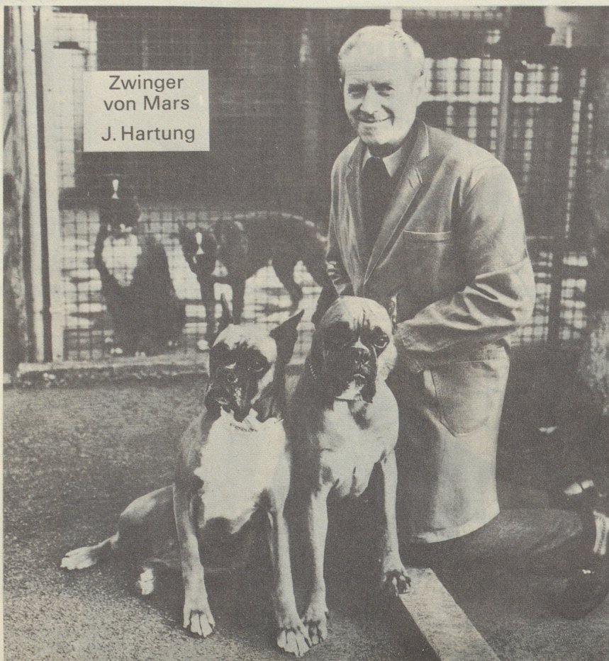
Zwinger von Mars J. Hartung