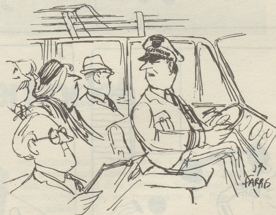
«Natürlich gehöre ich zum Departement Bonvin, deshalb brauchen Sie mich aber noch lange nicht Furka-Wühlmaus zu schimpfen!»