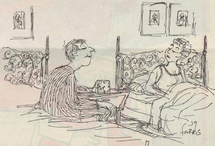
«Beim nächsten Béliet-Streich darf ich auch eine Petarde werfen!»

Gesehen, gelesen und geknipst! Ein guter Bibelspruch, der in löblicher Absicht an diesen Baum geheftet wurde. Ob der Mann aus Ettingen auch etwas gedacht hat, als er seine Einladung zum Grümpel-Turnier unter Jakobus 4, 17 angeschlagen hatte!