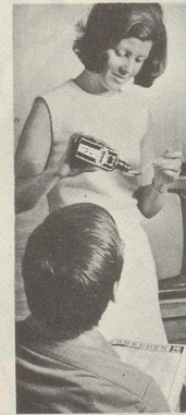
Zellerbalsam bewährt sich heute wie vor 100 Jahren.

Wenn uns Magen- und Darmbe- schwerden quälen, wenn das Essen nicht schmecken will, wenn Magen- druck, Aufstossen, Blähungen eine ge- störte Verdau-