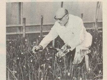
Zur Prüfung des Arzneigehalts wird einem Pflanzenbeet eine Probe entnommen.

Ja – Frauen leiden häufiger unter Verstopfung als Männer, beson- ders unter chronischer Darmträg- heit. Auch in chronischen Fällen kann ein pflanzliches Abführmittel wie Zeller Feigensirup den Darm bewegen, seine Funktionen wieder normal auszuüben. Als rei- nes Arzneipflanzenmittel ist Zeller Feigensirup auch Schwan- geren, älteren Menschen und bettlägerigen Patienten zu emp- fehlen. Er wirkt mild und doch sicher und ist gut verträglich. Weil Zeller Feigensirup gut schmeckt, nehmen ihn auch Kinder gern.