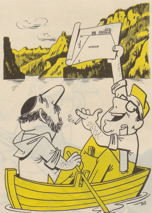
Zeichnung: W. Büchi

Wohin mit den 1,5 Millionen Kubikmeter Aushubmaterial aus dem Seelisbergtunnel? Die Lösung: