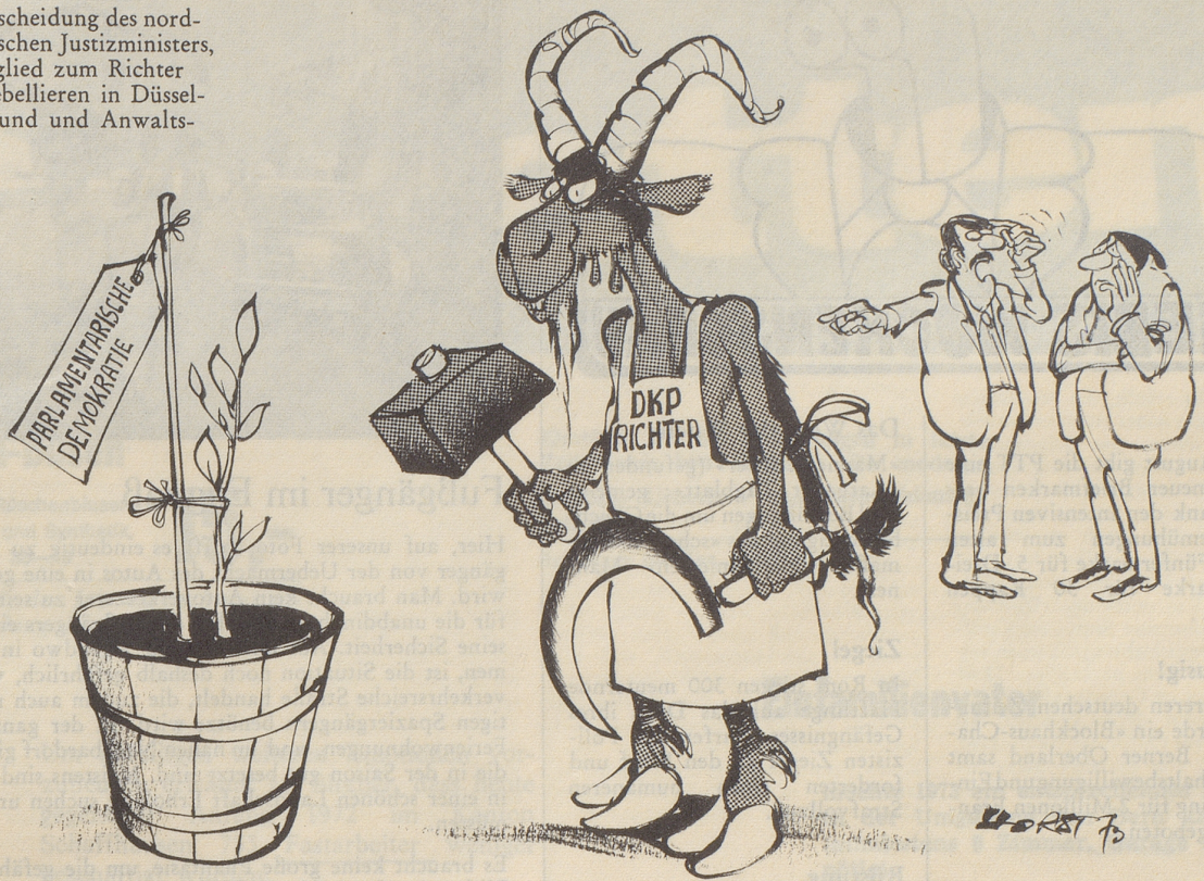
«... Blödsinn, warum soll denn das kein guter Gärtner sein!»

Gegen die Entscheidung des nordrhein-westfälischen Justizministers, ein DKP-Mitglied zum Richter zu machen, rebellieren in Düsseldorf Richterbund und Anwaltskammer.