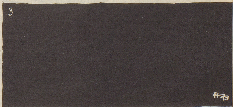
Aufhellung der Affäre Steiner