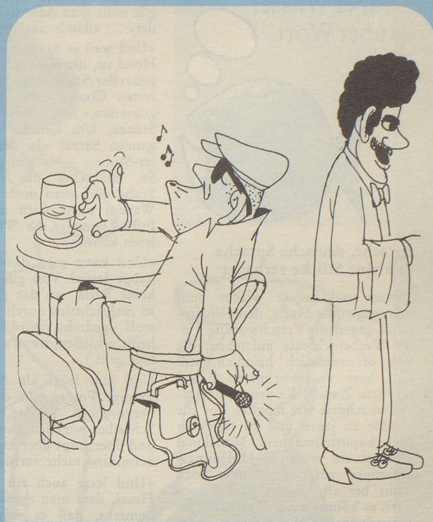
Kein Mensch würde auf die Idee kommen, daß dieser unauffällige Mann die Aufgabe hat, die Gespräche ausländischen Servierpersonals auf ihren subversiven Charakter hin zu prüfen.