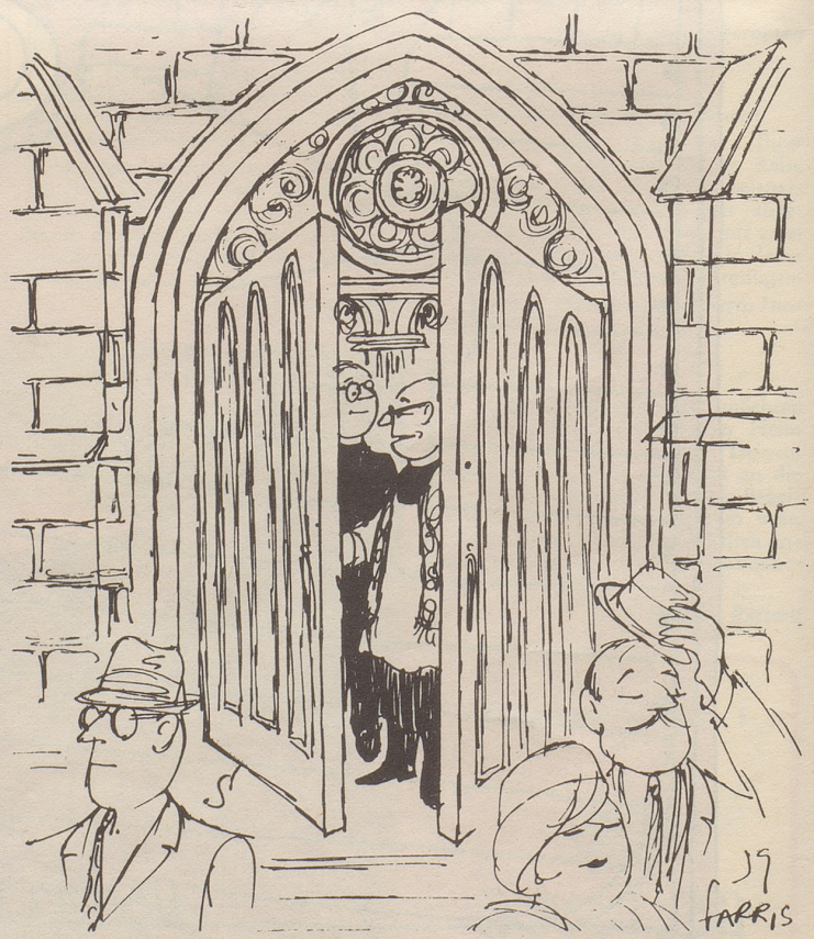
«... und doch habe ich das unangenehme Gefühl, mit meiner Predigt gegen den «Letzten Tango» für die Kinos der Nachbarkantone Reklame gemacht zu haben ...»