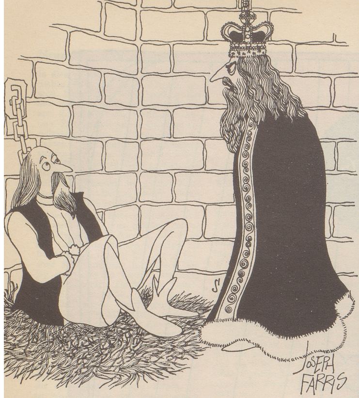
«Als ich dich rief, o Leo, die Verschwendungssucht im Lande zu bekämpfen, meinte ich damit natürlich nicht meine eigene und die meiner Aeltestenräte!»