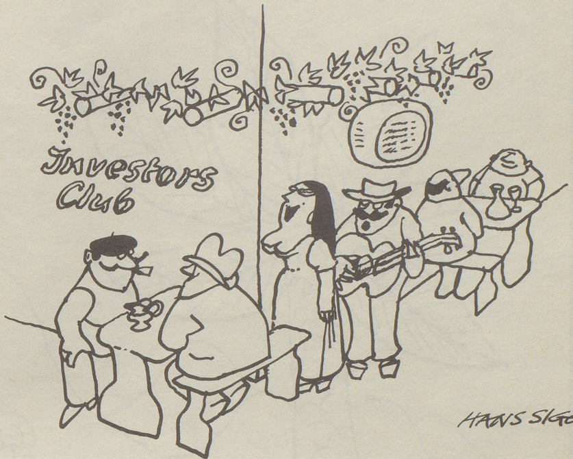
Dieses Bankhaus in Lugano, im Volksmund gerne «Fluchtkapitalzwinger» genannt, versucht Geschäft mit Muse zu verbinden.