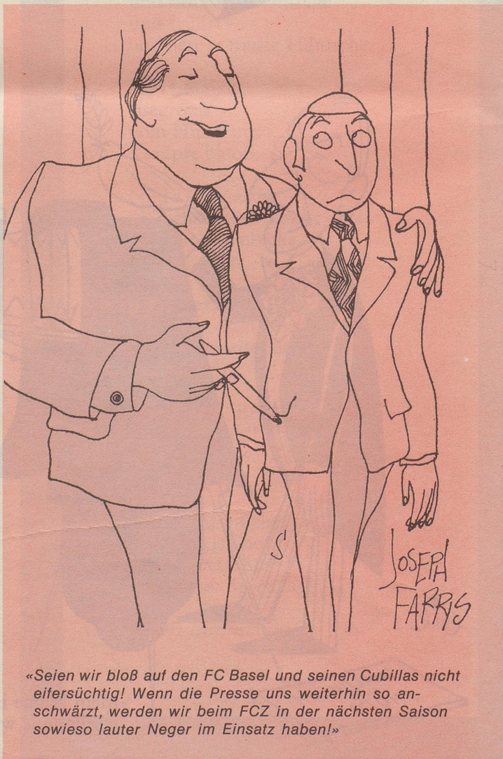
«Seien wir bloß auf den FC Basel und seinen Cubillas nicht eifersüchtig! Wenn die Presse uns weiterhin so anschwärzt, werden wir beim FCZ in der nächsten Saison sowieso lauter Neger im Einsatz haben!»