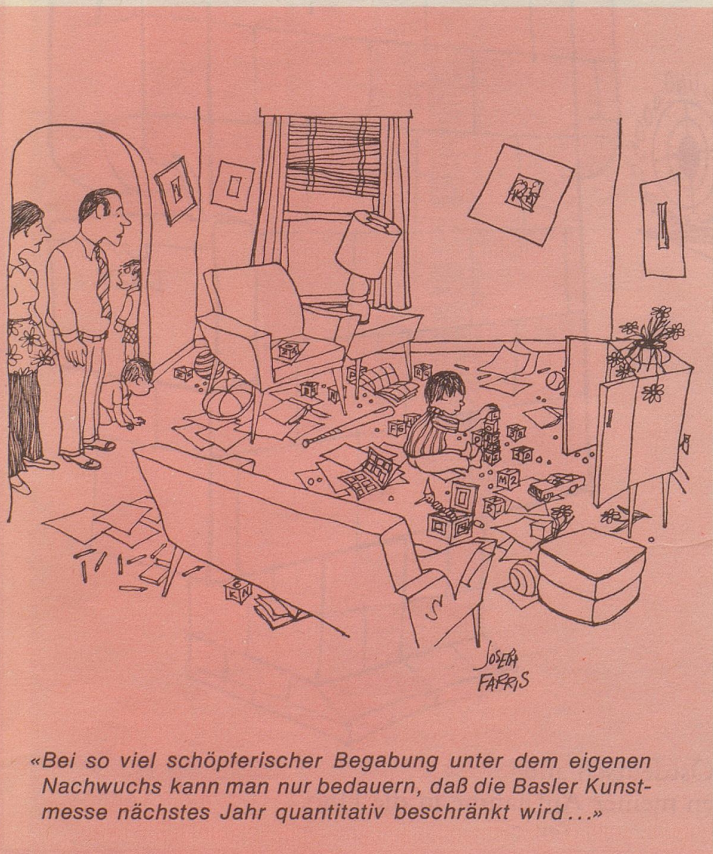
«Bei so viel schöpferischer Begabung unter dem eigenen Nachwuchs kann man nur bedauern, daß die Basler Kunstmesse nächstes Jahr quantitativ beschränkt wird...»