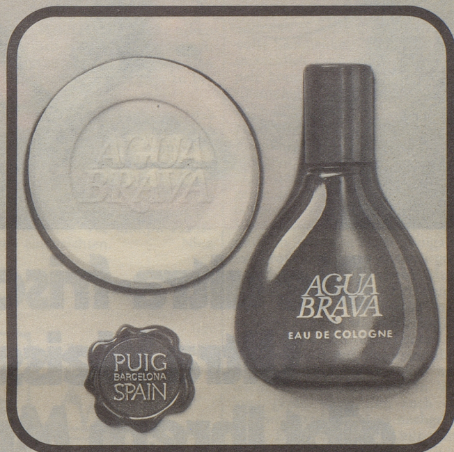
Abbildung in Original-Grösse