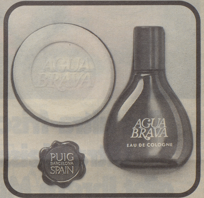
Abbildung in Original-Grösse