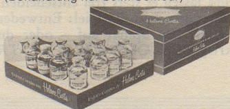
Endoten Control Coiffeur-Service-Fläschchen

Endoten Control erhältlich in zwei Grössen: Normalflasche und Sparflasche