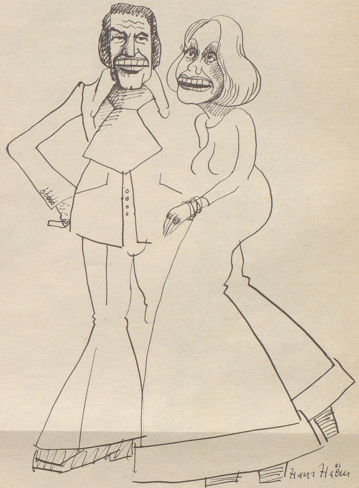
Auf großen Füßen leben