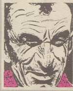
Us em Innerrhoder Witztröckli

«Heute hatte ich Pech», berichtet White. «Ich habe eine Frau auf der Straße geküßt und wurde verhaftet. Und als der Richter die Frau sah, verurteilte er mich zu zehn Dollar, weil ich betrunken gewesen sein muß.»