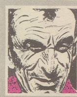
Us em Innerrhoder Witz- tröckli

«Heute hatte ich Pech», berichtet White. «Ich habe eine Frau auf der Straße geküßt und wurde verhaftet. Und als der Richter die Frau sah, verurteilte er mich zu zehn Dollar, weil ich betrunken gewesen sein muß.»