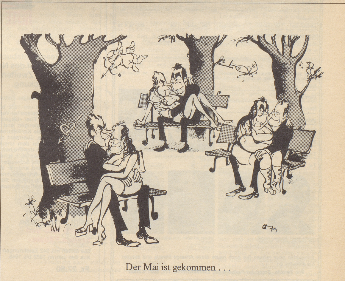
Der Mai ist gekommen . . .