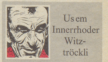
Us em Innerrhoder Witztröckli

De Giigelihannes het am Wiib of em Todbett no ees gspilt ond dezue gsäat: «Lueg, Amerei, mit Giige sömmer zemechoo, ond mit Giige wemmer wider vonenand!»