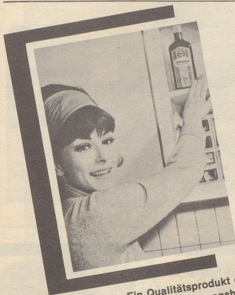
Ein Qualitätsprodukt der Max Zeller Söhne AG, 8590 Romanshorn

Immer wenn's mit der Verdauung hapert, wenn der Magen rebelliert, greifen mein Mann und ich zum