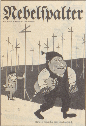
Hans im Glück hat sein Land verkauft

Während ich den Nebelspalter Nr. 7 traditionsgemäß und mit Genugtuung zweimal gelesen habe, ist inzwischen in Basel die Fasnacht ausgebrochen, und Ihr Titelbild von Barth ist ein wunderbares Fasnachtsujet.