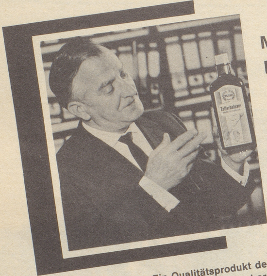
Ein Qualitätsprodukt der Max Zeller Söhne AG, 8590 Romanshorn