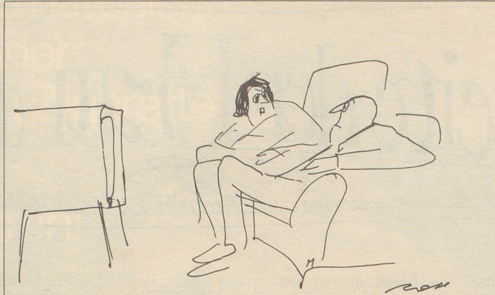
«... wo liegt eigentlich dieser berühmte Sektor, aus dem unsere Wettervorhersage immer die Winde nimmt?»