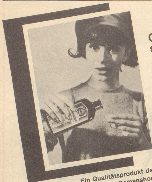
Ein Qualitätsprodukt der Max Zeller Söhne AG, 8590 Romanshorn

Gegen Magenbeschwerden, Unwohlsein, Verdauungsstörungen, Magendruck, Aufstossen und Reiseübelkeit nehme ich