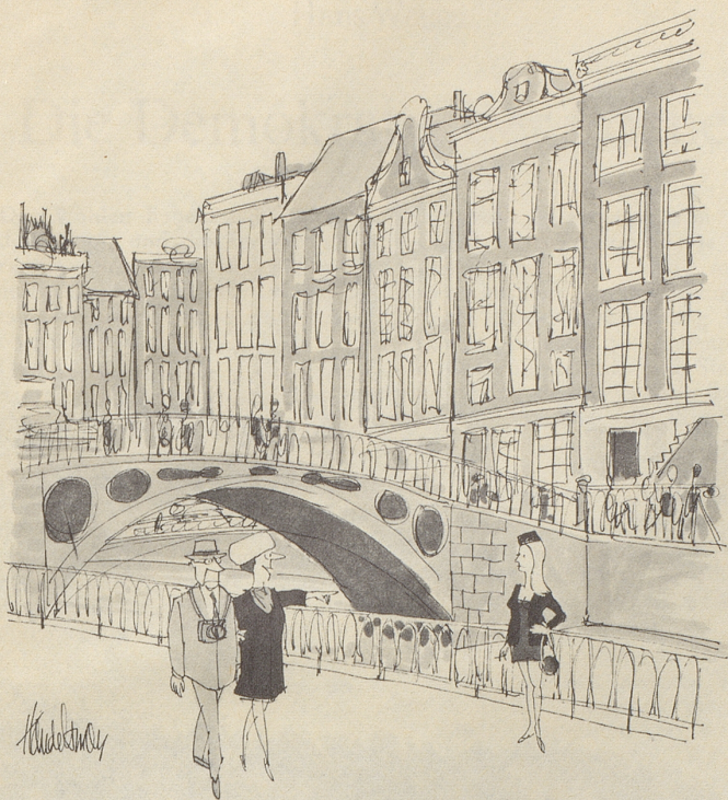
«Schau einmal! So etwas haben wir doch neulich in einem St.-Pauli-Film gesehen!»

WWF, sie versanken in der Arbeit, ob wir so nett wären... und ob wir vielleicht Zeit hätten, Adressen zu schreiben, nur ein paar hundert oder so... Mit der Post kam eine Einladung an meinen Mann: zweitägige Konferenz in Thun für Pilzexperten. Ich freute mich schon auf zwei Tage dolce far niente. Ja chasch dänke! Wie wenn sie es geahnt hätten, kreuzten zwei Damen auf vom Frauenverein: Sie hätten einen hübschen kleinen Basar zugunsten der Kinderkrippe, ob ich so nett wäre (schon wieder) und einen Stand betreuen würde. Ich bin natürlich so nett, weil ich gar keinen Grund habe, es nicht zu sein. Nächste Woche müssen dann noch dringend die Dahlienknollen versorgt und die Tulpen gesetzt werden. Aber nachher, wir garantieren, da machen wir Blauen! Wänn nüt derzwüsche chunnt! Mariann