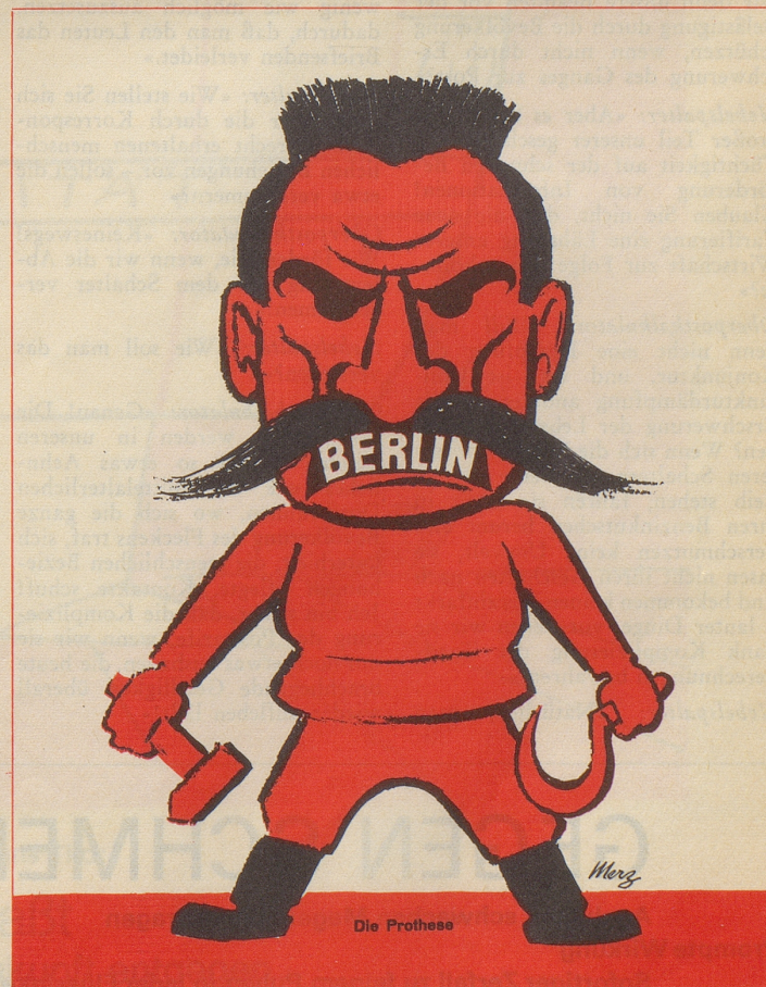
Die Prothese – heute noch aktuell wie damals. Karikatur aus dem «Nebelspalter» (1948)