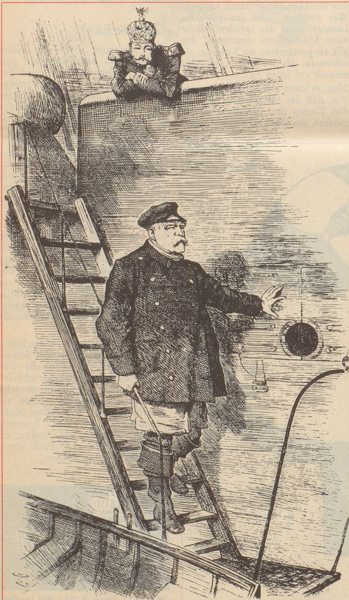
«Der Lotse verläßt das Schiff.» Ein prophetisches Spottbild aus dem «Punch» (1890)

Daß Witz und ein lachendes Wort oft die ernstesten Dinge treffender und schärfer charakterisieren als ernste Kritik, das erkannte schon Horaz und mit ihm viele weise Fürsten, die Narrenfreiheit gewährten. So dienten Witz und Karikatur schon in den frühesten Zeiten menschlicher Geschichte dazu, Kritik an Gesellschaft und Politik zu üben. Witz war bei unseren Vorfahren noch gleichbedeutend mit Weisheit (etwa entsprechend dem französischen esprit) und man verstand darunter also nicht bloß eine zotige Platitüde. In den Worten Mutterwitz, Schulwitz, Aberwitz, Vorwitz, Wahnwitz und dem Sprichwort «Witz kommt nicht vor der Zeit», finden wir noch etwas vom alten Ursprung; Scharfsinn, Witz und Karikatur waren deshalb stets beliebte Waffen im politischen Kampf. Wo man mit sachlichen Argumenten nichts ausrichten konnte, da übertrieb man die Schwäche des Gegners ins Lächerliche. Der nützliche Gebrauch von Witz und Karikatur wird also stets der sein, den Menschen den Spiegel vorzuhalten, ihnen zu zeigen, daß ihr Gebaren in dieser oder jener Sache vernunftwidrig sei, damit Schwächen ins richtige Licht zu stellen, das heißt greller zu beleuchten und so gegen Schwärmerei, Despotismus, Barbarei und Dummheit anzukämpfen.