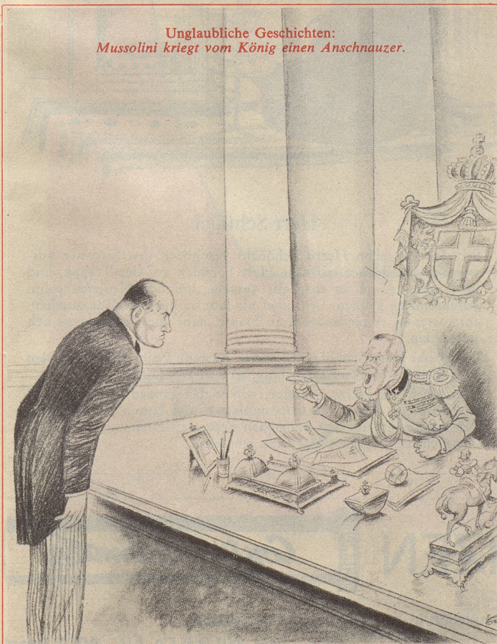
1932 zeichnete Fritz Eichenberg für den «Uhu» die Karikatur, die 1944 wahr wurde.