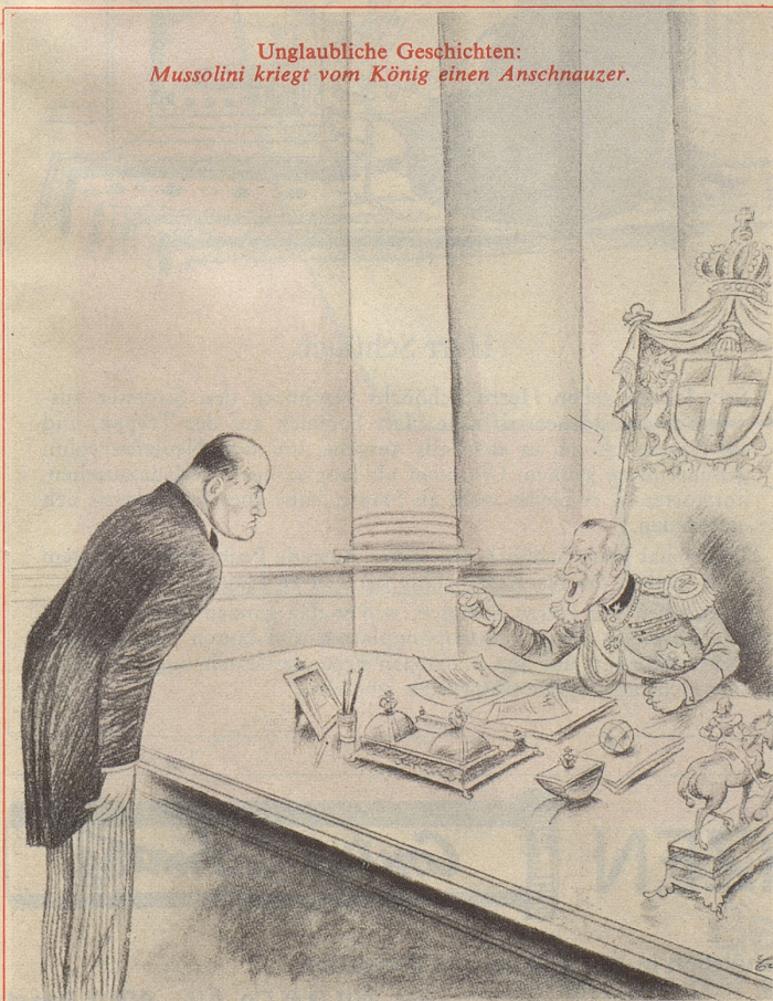
Unglaubliche Geschichten: Mussolini kriegt vom König einen Anschnauzer.

Lachend kann man eben Wahrheiten und Prophetisches doch besser sagen als ernst. Darum sollten eigentlich Staatsmänner wieder mehr als in letzter Zeit auf die Hofnarren unserer Zeit, die Karikaturisten hören, die wirklich Weisen, die Seismographen politischer Beben; dann ließen sich künftige Kriege vermeiden.