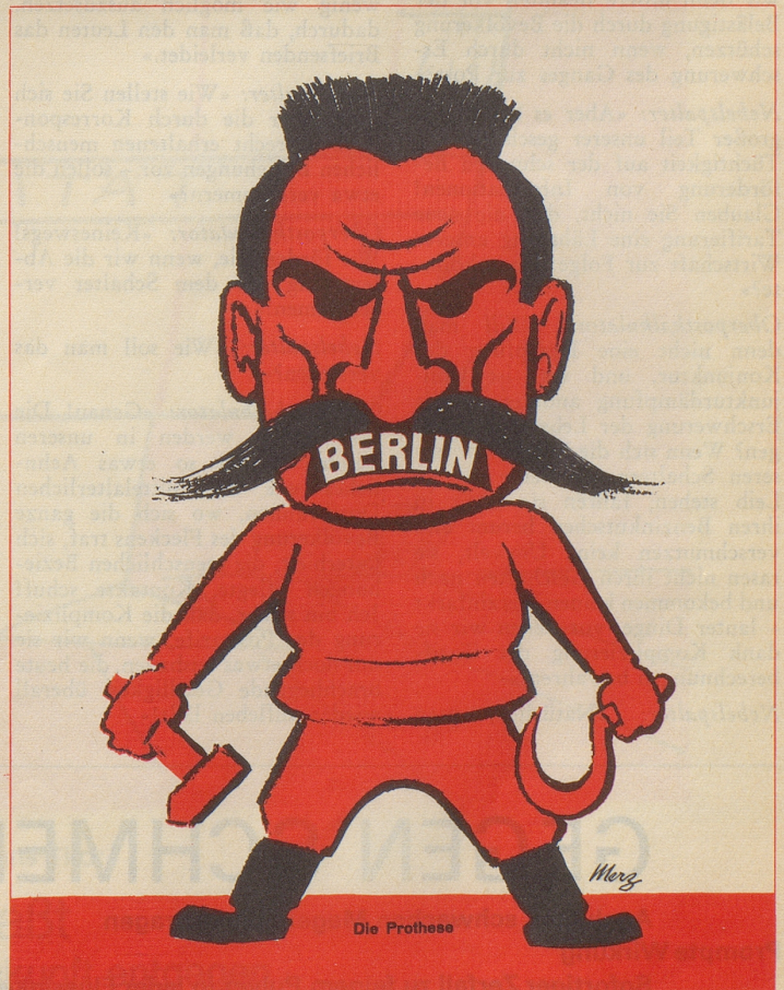
Die Prothese – heute noch aktuell wie damals. Karikatur aus dem «Nebelspalter» (1948)